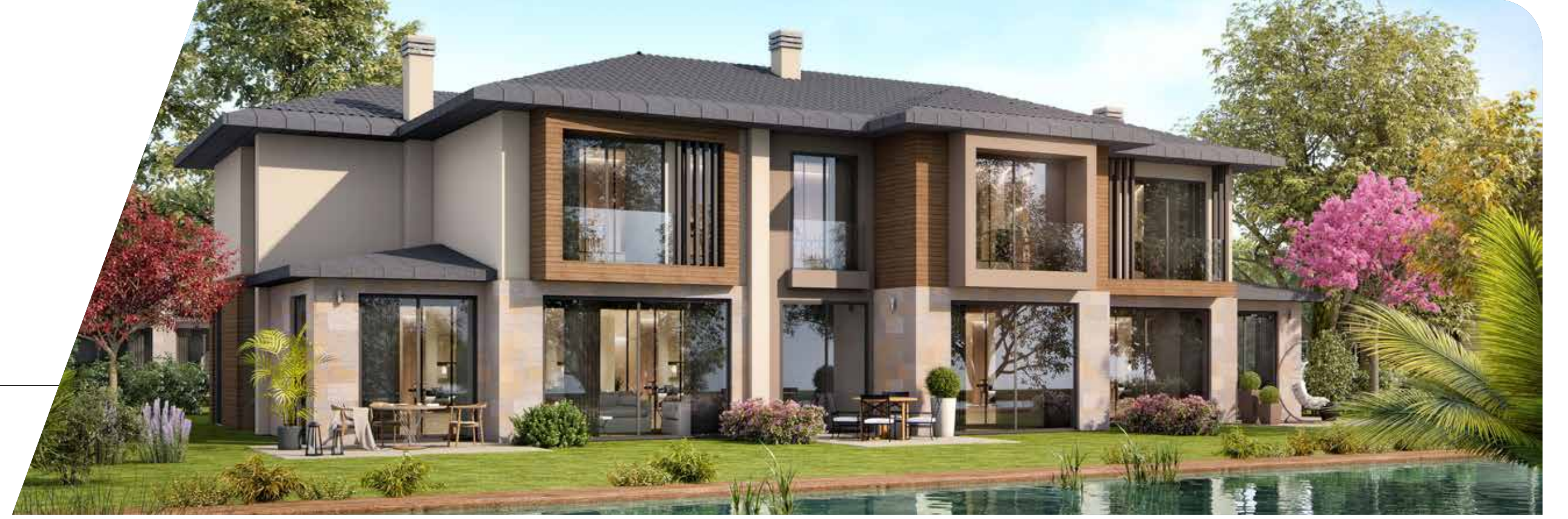
B Blok Ön Cephe