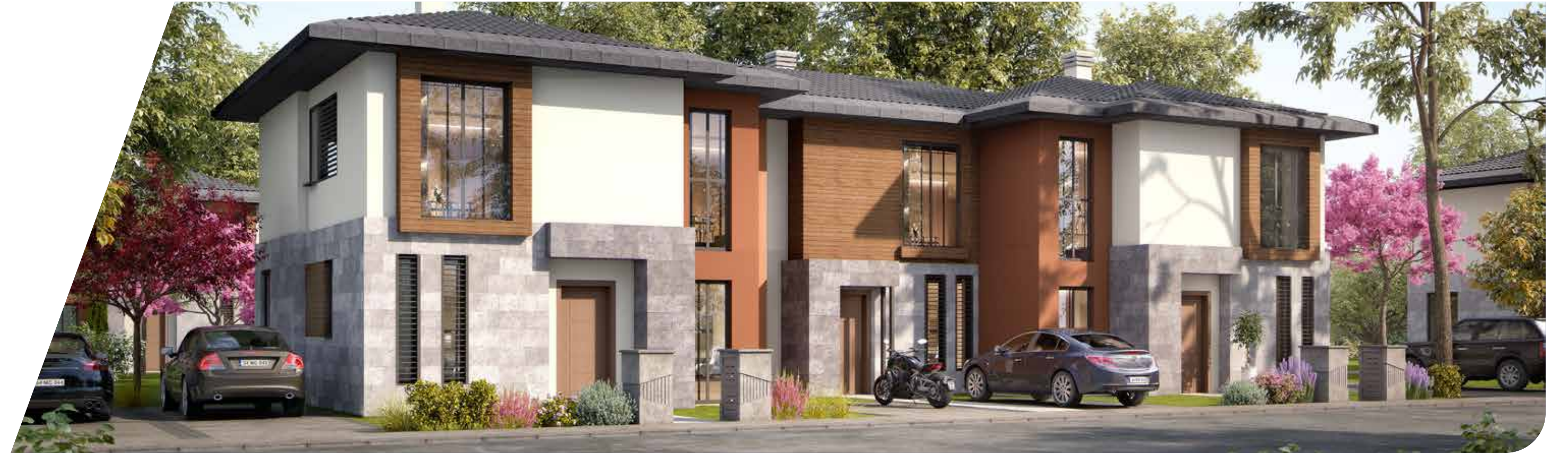
C Blok Arka Cephe