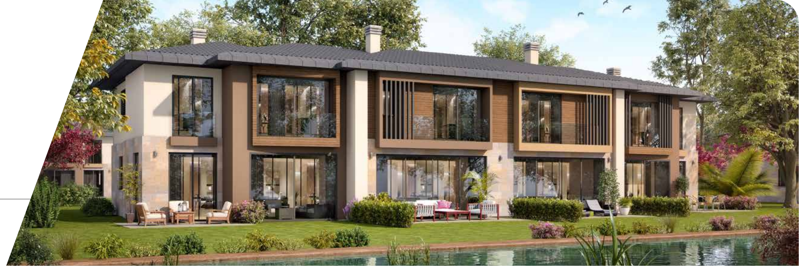
D Blok Ön Cephe