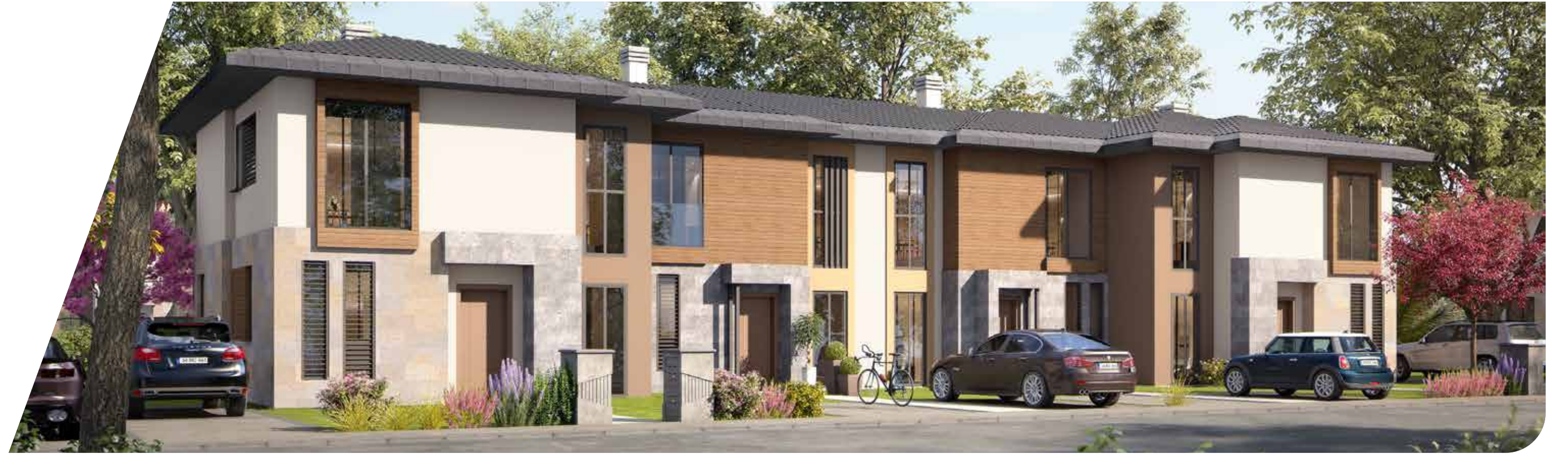
D Blok Arka Cephe