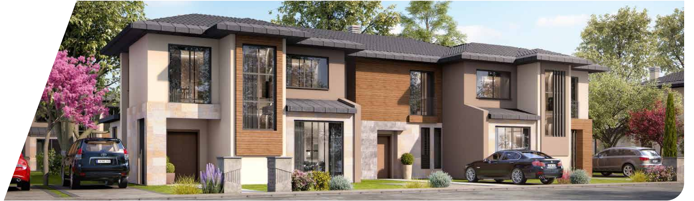
B Blok Arka Cephe