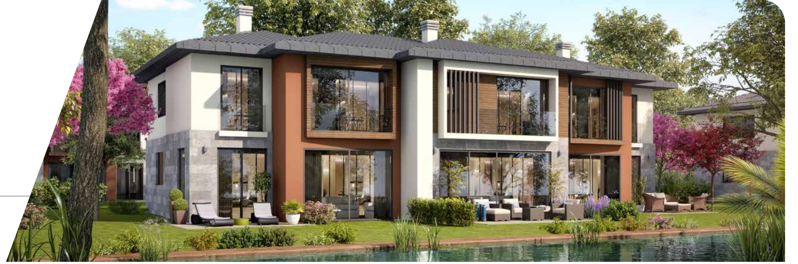
C Blok Ön Cephe