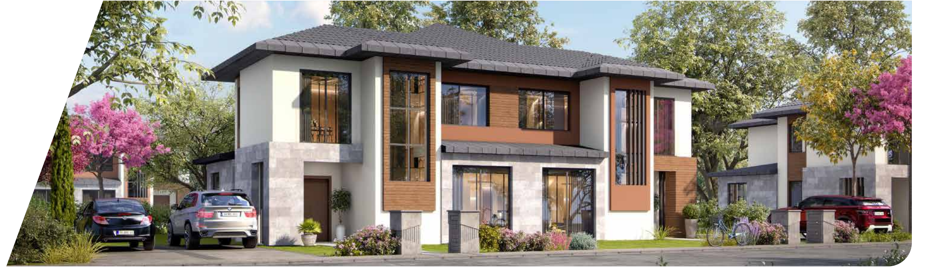
A Blok Arka Cephe