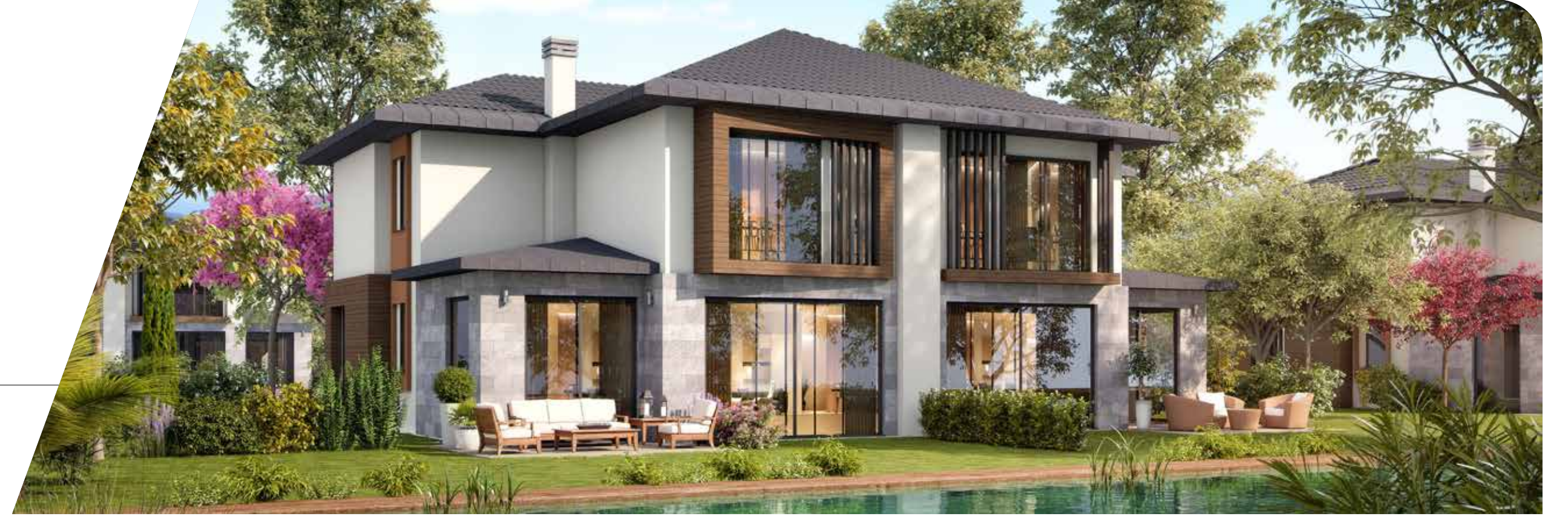
A Blok Ön Cephe

Yanyana 2 adet 4+1 bahçeli dubleks evden oluşmaktadır.